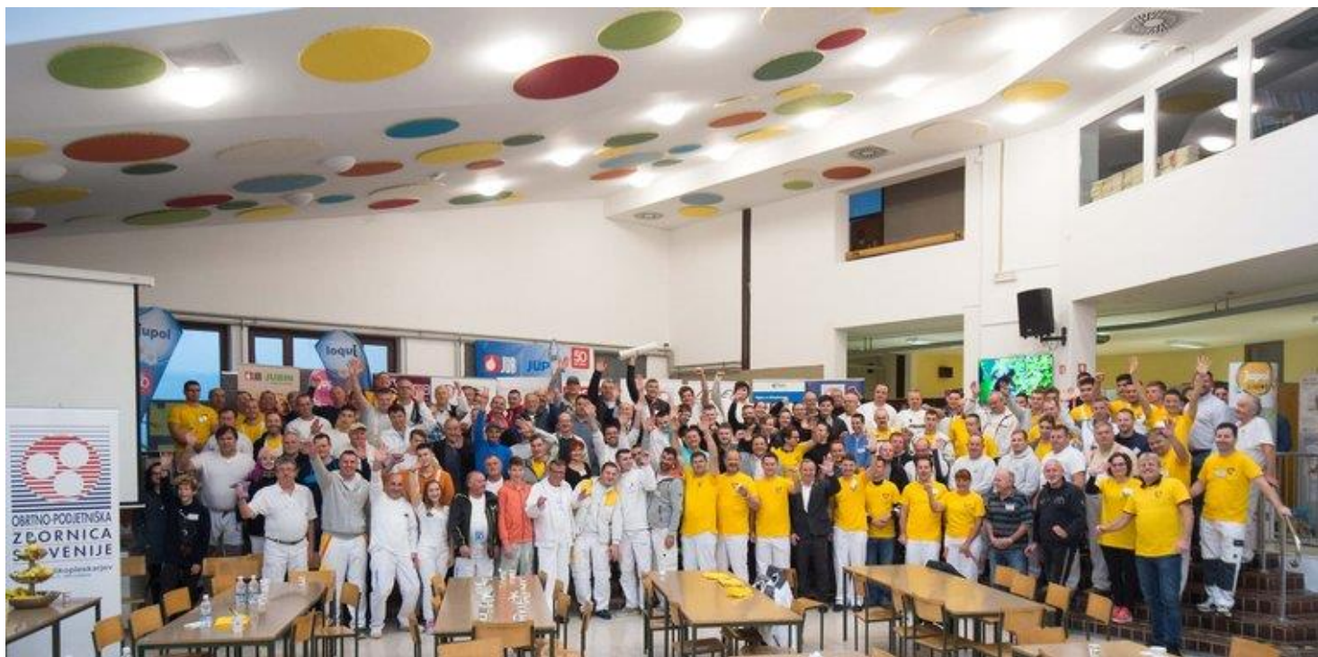
Slikopleskarji v Osnovni šoli Ormož

V okviru humanitarne akcije je sekcija slikopleskarjev pri OZS organizirala tudi 21. državno tekmovanje.